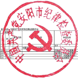
2019年一般公共预算支出情况表