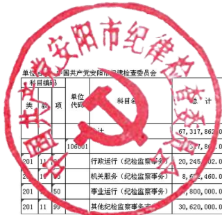
2019年部门支出总体情况表